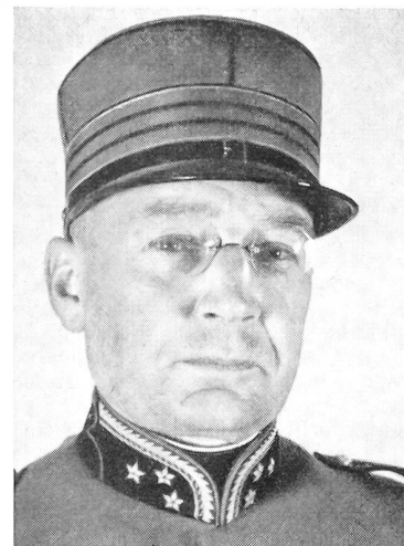
Oberst Jakob Joho

Diese Anforderungen konnten nicht in einem einzigen Bundesprogramm untergebracht werden. Das EMD, respektive die Sektion für außerdienstliche Tätigkeit unter Sektionschef Oberst Emil Lüthy, hat mit der Zweiteilung eine Lösung gefunden, welche den Vorteil hat, dem Schießpflichtigen Abwechslung, sozusagen Promotionsfreude zu vermitteln.