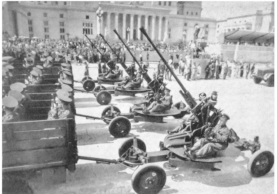
Polnische Flak an einer Parade in Warschau.

Die Nato-Staaten haben etwa 3,1 Millionen Soldaten heute unter Waffen. —