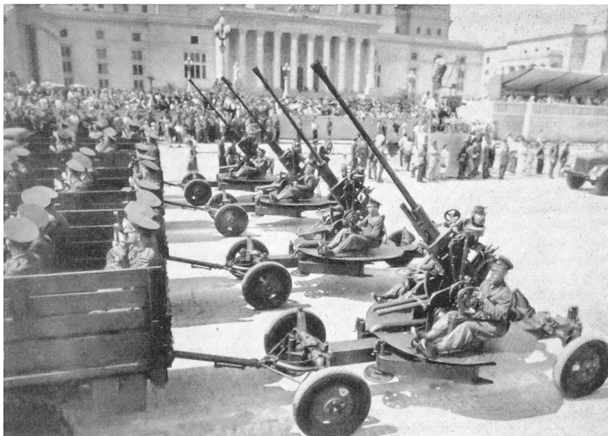
Polnische Flak an einer Parade in Warschau.

Die Nato-Staaten haben etwa 3,1 Millionen Soldaten heute unter Waffen. —