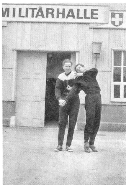
Der Hilfspolizist muß sich auch in Polizei-griffen auskennen.

Das Programm umfaßt ca. zehn einstündige Lektionen mit viel Lockerungsgymnastik, einfachen Polizeigriffen und Teilen der waffenlosen Selbstverteidigung, ferner Partnerübungen, Spiele usw. Die Leitung