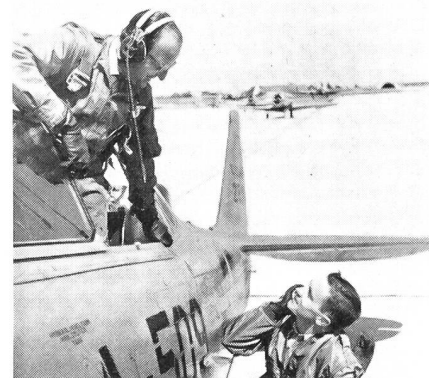
Auf einem Flugplatz der jungen Luftwaffe der Deutschen Bundesrepublik.

An der Spitze jedes Wehrbereiches steht der Befehlshaber im Wehrbereich, dem die Dienststellen und Einrichtungen der Terri-