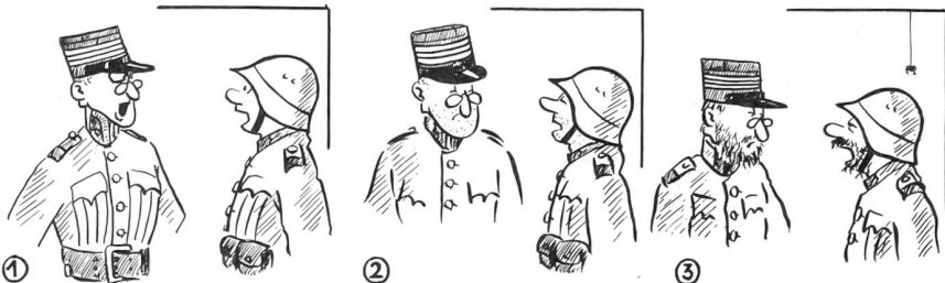
1. «Schildwachbefehl!» «Herr Oberscht, Kanonier Brunner. Ich bin einfache Schildwache vor dem ... 2. ... und bewache das Magazin usw.... 3. ... ich kontrolliere usw....

Zum Thema: Wache und überlanger Wachbefehl