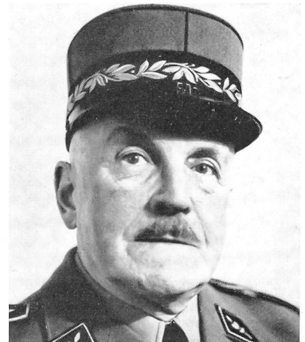
Oberstbrigadier Walter Königs

In Bern verschied im Alter von 69 Jahren Oberstbrigadier Walter Königs. 1888 in Zürich geboren, war der Verstorbene Instruktionsoffizier der Kavallerie und der Leichten Truppen. Er wirkte im Range eines Oberstbrigadiers als Kommandant des Territorialkreises I, bis er im Jahre 1954 in den Ruhestand trat. Unter dem Beinamen der «Radfahrergeneral» war er im ganzen Land als eine beinahe legendäre Figur bekannt. ATP