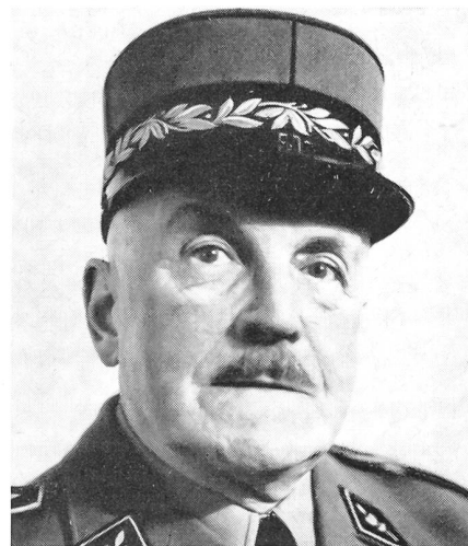
Oberstbrigadier Walter Königs

In Bern verschied im Alter von 69 Jahren Oberstbrigadier Walter Königs. 1888 in Zürich geboren, war der Verstorbene Instruktionsoffizier der Kavallerie und der Leichten Truppen. Er wirkte im Range eines Oberstbrigadiers als Kommandant des Territorialkreises I, bis er im Jahre 1954 in den Ruhestand trat. Unter dem Beinamen der «Radfahrergeneral» war er im ganzen Land als eine beinahe legendäre Figur bekannt.