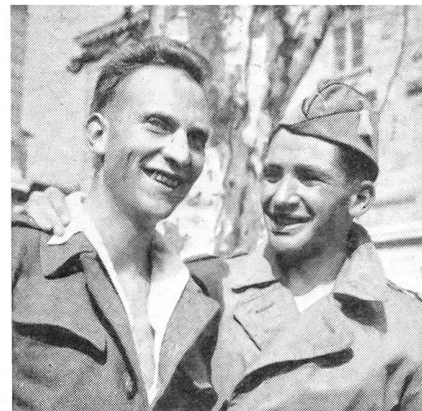
Gedenklauf Le Locle—Neuenburg:

Die japanische Wehrmacht besteht nur aus Freiwilligen. Es gibt 49 Werbestellen, die unter der Bevölkerung eine nachdrückliche militärische Propaganda entfalten. Besondere Aufmerksamkeit widmet man dem Offiziersnachwuchs. Von den gegenwärtig aktiven Offizieren sind bei der Armee 35,4 %, bei der Marine 85,1 % und bei der Luftwaffe 58,6 % alte Offiziere, die schon den letzten Krieg mitgemacht haben. Viele Offiziere werden in den Vereinigten Staaten oder aber in den amerikanischen Militärlagern in Japan ausgebildet.