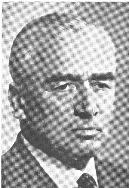
Oberstkorpskommandant Gübeli 70jährig. Am 28. Dezember beging in Luzern, wo er im Ruhestand lebt, der ehemalige Kommandant des 2. Armeekorps, Oberstkorpskommandant