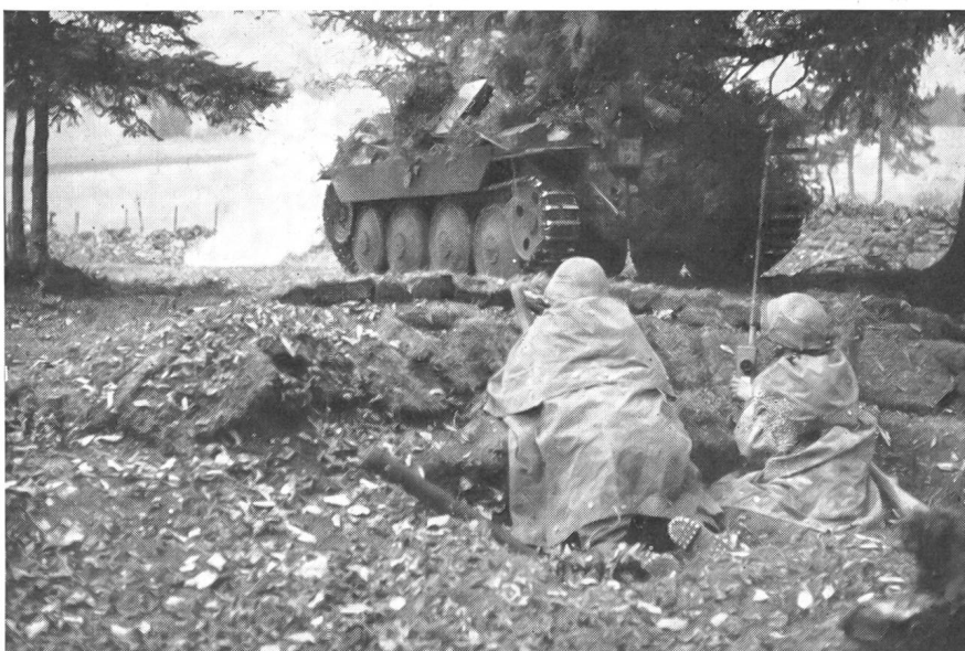
Zusammenarbeit von Infanterie und Leichten Truppen: Kombiniertes Einsatz von Infanterie und Panzern.