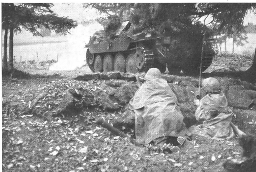
Zusammenarbeit von Infanterie und Leichten Truppen: Kombinierter Einsatz von Infanterie und Panzern.