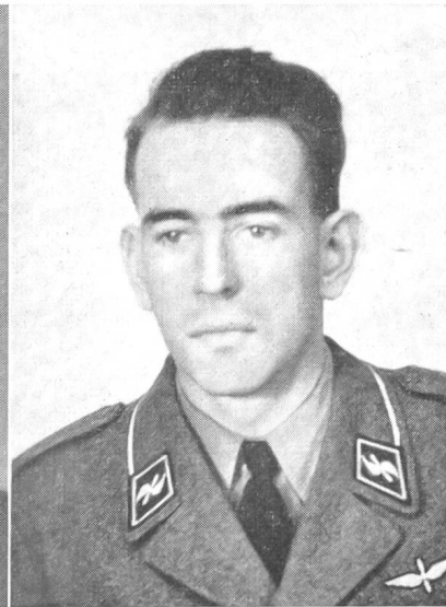
Anläßlich eines Orientierungsfluges stürzte der 22jährige

Der Verstorbene war von 1940 an Wachchef der Infanterie und von 1947 bis zu seiner Pensionierung im Jahre 1951 Militärattaché in Stockholm.