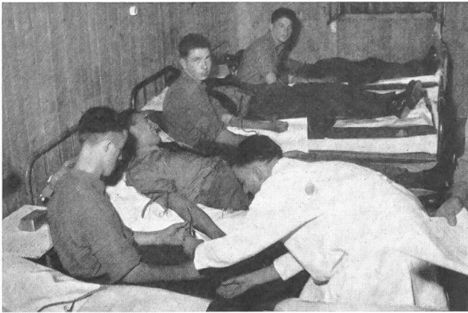
Alljährlich werden in den Rekrutenschulen zahlreiche Blutentnahmen zur Gewinnung von Trockenplasma, Plasma-Fractionen und Testseren durchgeführt.

mit Alkohol bei tiefen Temperaturen rein dargestellt werden. Die wichtigsten dieser reinen Bluteiweiße, auch Plasmafraktionen genannt, sind das Albumin , das Gammaglobulin und das Fibrinogen . Diese Präparate werden ebenfalls im Zentrallaboratorium hergestellt. Albumin dient wie Trockenplasma zur Bekämpfung von Schockzuständen und zur Behandlung von Eiweißmangelkrankheiten. Gammaglobulin ist der Träger der bei der Infektionsabwehr so wichtigen Antikörper. Fibrinogen spielt eine maßgebliche Rolle bei der Behandlung von gewissen Blutgerinnungsstörungen. Das Blutplasma kann bei der Behandlung von Schockzuständen, wo es in erster Linie darauf ankommt, den Blutkreislauf mit einer Lösung aufzufüllen, die im Kreislauf verweilt, bis zu einem gewissen Grade durch Plasmaersatzpräparate ersetzt werden. Die besten heute bekannten Plasmaersatzpräparate sind das Dextran, das Polyvinylpyrrolidon und die Gelatineabkömmlinge Oxypolygelatine und Bernsteinsäuregelatine. Alle diese Präparate sind aber kaum mehr als Lückenbüßer in Notfallsituationen, bei denen nicht genügend Plasma zur Verfügung steht, zu bewerten. Ihre wesentliche Rolle spielen sie im Kriege, wo sicher dauernd ein erheblicher Mangel an Vollblut und Plasma herrscht.