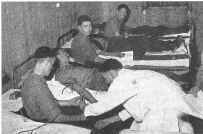
Alljährlich werden in den Rekrutenschulen zahlreiche Blutentnahmen zur Gewinnung von Trockenplasma, Plasma-Fractionen und Testseren durchgeführt.

mit Alkohol bei tiefen Temperaturen rein dargestellt werden. Die wichtigsten dieser reinen Bluteiweiße, auch Plasmafraktionen genannt, sind das Albumin , das Gammaglobulin und das Fibrinogen . Diese Präparate werden ebenfalls im Zentrallaboratorium hergestellt. Albumin dient wie Trockenplasma zur Bekämpfung von Schockzuständen und zur Behandlung von Eiweißmangelkrankheiten. Gammaglobulin ist der Träger der bei der Infektionsabwehr so wichtigen Antikörper. Fibrinogen spielt eine maßgebliche Rolle bei der Behandlung von gewissen Blutgerinnungsstörungen. Das Blutplasma kann bei der Behandlung von Schockzuständen, wo es in erster Linie darauf ankommt, den Blutkreislauf mit einer Lösung aufzufüllen, die im Kreislauf verweilt, bis zu einem gewissen Grade durch Plasmaersatzpräparate ersetzt werden. Die besten heute bekannten Plasmaersatzpräparate sind das Dextran, das Polyvinylpyrrolidon und die Gelatineabkömmlinge Oxypolygelatine und Bernsteinsäuregelatine. Alle diese Präparate sind aber kaum mehr als Lückenbüsser in Notfallsituationen, bei denen nicht genügend Plasma zur Verfügung steht, zu bewerten. Ihre wesentliche Rolle spielen sie im Kriege, wo sicher dauernd ein erheblicher Mangel an Vollblut und Plasma herrscht.