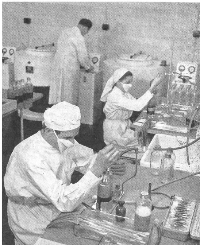
Im Zentrifugierraum wird das Plasma vom Vollblut abgehebert und steril in Flaschen zu 250cm 3 abgefüllt. Anschließend wird das Plasma tiefgefroren und in gefrorenem Zustande getrocknet.

Heute, wie auch in der nächsten Zukunft steht der Blutspendendienst des Schweizerischen Roten Kreuzes vor großen Aufgaben. Um seine bisherigen Leistungen weiterführen und um weitere für die Volksgesundheit und den Armeesanitätsdienst bedeutsame Aufgaben übernehmen zu können, bedarf er wie bis anhin der einsichtigen Unterstützung des ganzen Volkes.