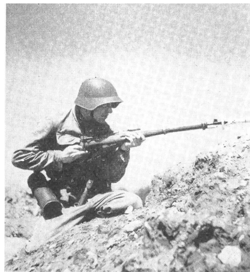
Die Panzerabwehr mit der Panzer-Wurfgranate, die 1950 in das außerdienstliche Arbeitsprogramm des SUOV aufgenommen wurde, ist in allen Unteroffiziersvereinen zu einer beliebten Disziplin geworden. Diese Aufnahme wurde anlässlich der SUT-Vorbereitungen in einer der 136 Sektionen des SUOV aufgenommen.

Die Kampfgruppenführung am Sandkasten ist eine der wertvollsten Disziplinen außerdienstlicher Tätigkeit des Schweizerischen Unteroffiziersverbandes. Sie stellt die Unteroffiziere, entsprechend ihrer Waffengattung und Gradfunktion, vor eine taktische Situation. Die Übungen umfassen die Führung von kleinen Verbänden, wie Gruppe, Patrouille, gemischte Detachements in höchstens Zugstärke. Der Konkurrent erhält auf dem Aufgabenbüro 12 Minuten vor Beginn der Prüfung einen verschlossenen Umschlag, auf welchem die Sandkastenummer angegeben ist, die Ausgangslage, der erste Auftrag und die Aufgabennummer. Er begibt sich hierauf in das Vorbereitungszimmer, wo er den Umschlag öffnen darf und rund 10 Minuten Zeit hat, sich an Hand eines Orientierungs-Sandkastens das Gelände und die allgemeine Lage einzuprägen und den ersten Auftrag zu überlegen. Genau auf die vorgesehene Prüfungszeit steht er vor seinem Prüfungszimmer, um sich auf Abruf beim Kampfrichter zu