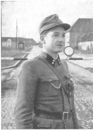
Typ eines jungen Unteroffiziers des Bundesheeres, der Wachtkommandant der Panzerschule von Hörsching.