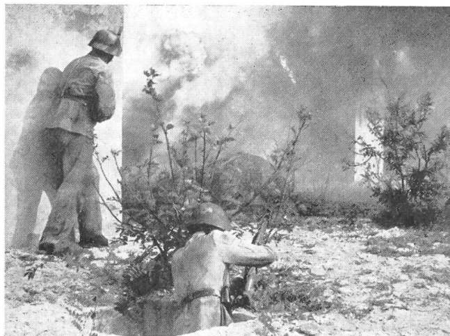
Grenadiere im Ortskampf

** Alexander Papagos, «Griechenland im Kriege 1940—1941», Verlag Schimmelbusch & Co., Bonn.