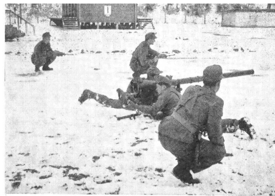
Gruppenausbildung am rückstoßfreien Geschütz, das von zwei Mann leicht getragen und in verschiedenen Stellungen eingesetzt werden kann. Es ist auch eine vorzügliche Panzer-Abwehrwaffe. Die Gruppe besteht mit Gruppenführer und Sicherern aus fünf Mann

Vorweg sei gesagt, daß das neue Bundesheer auf Jahre hinaus über genügend Kasernen und Waffenplätze verfügt, nachdem es von der einstigen deutschen Wehrmacht und den Amerikanern zahlreiche Einrichtungen übernehmen konnte, die teilweise allerdings einige Restaurierungsarbeiten verlangen. Die Bewaffnung für die Ausbildung und Ausrüstung der ersten Verbände ist heute reichlich vorhanden. Die amerikanische Armee hat Österreich bei ihrem Abzug ein Lager an Artillerie, Motorfahrzeugen, leichten und schweren Infanteriewaffen, Panzern, Funk- und Genieausrüstungen überlassen, das einen Wert von rund 60 Millionen Dollar hat und das, wie der Bericht-