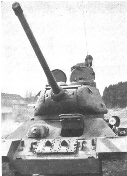
Russischer Panzer vom Typ T-34 in der Panzerschule von Hörsching, wo in einem strengen Dienstbetrieb die Kader für die künftigen Panzertruppen des Bundesheeres ausgebildet werden

An der unwiderstehlichen Gewalt der Verhältnisse scheitert selbst der beste Mann, und von ihr wird ebenso oft der mittelmäßige getragen. Aber Glück hat auf die Dauer doch zumeist nur der Tüchtige. Moltke.