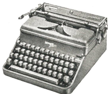
Hermes-Media die tausendfach bewährte Schweizer Armeemaschine, robuste und strapazierfähige Konstruktion Fr. 360.-