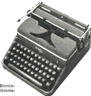
Hermes 2000 die Luxusportable mit den Einrichtungen einer modernen Büromaschine Fr. 470.-

Paillard SA, mit Werken in Yverdon und Ste-Croix (gegr. 1814) ist weltbekannt für ihre Leistungen auf dem Gebiet der Präzisionsmechanik. Die von ihr entwickelten HERMES-Schreibmaschinen tragen das Kennzeichen bester schweizerischer Qualitätsarbeit.