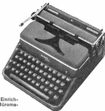
Hermes 2000 die Luxusportable mit den Einrichtungen einer modernen Büromaschine Fr. 470.—

Paillard SA. mit Werken in Yverdon und Ste-Croix ist seit 140 Jahren weltbekannt für ihre Leistungen auf dem Gebiet der Präzisionsmechanik. Die von ihr entwickelten HERMES-Schreibmaschinen tragen das Kennzeichen bester schweizerischer Qualitätsarbeit.