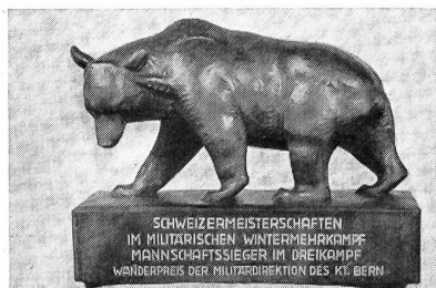
Der originelle Wanderpreis der Berner Militärdirektion, der dieses Jahr vom gegenwärtigen Besitzer, den Grenzwächtern, hart verteidigt werden dürfte.