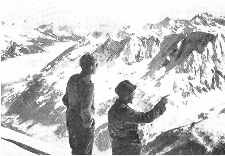
Aussicht vom Pizzo di Pesciora (3123 m). Rechts Campo Lungo und Campo Tencia. Unten das Bedrettotol und unter der Nebelschicht die obere Leventina