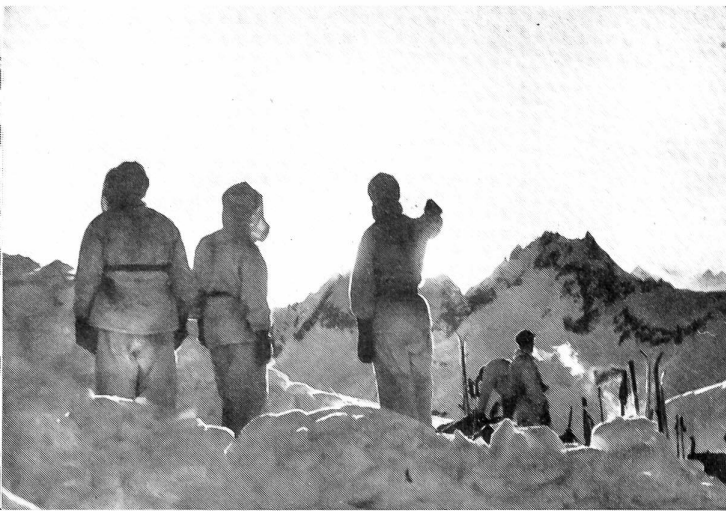
Sonnenuntergang beim Schneebiwak auf dem Wittenwasser-Paß (2840 m). Blick gegen die Saashörner und die Berner Oberländer Berge