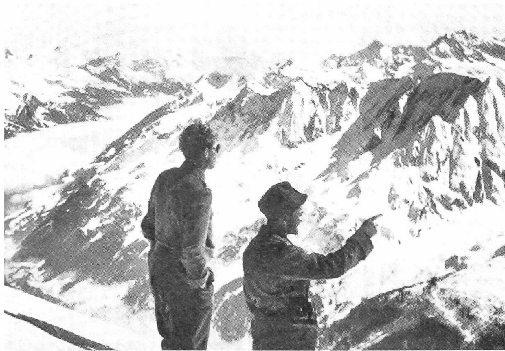
Aussicht vom Pizzo di Pesciora (3123 m). Rechts Campo Lungo und Campo Tencia. Unten das Bedrettal und unter der Nebelschicht die obere Leventina