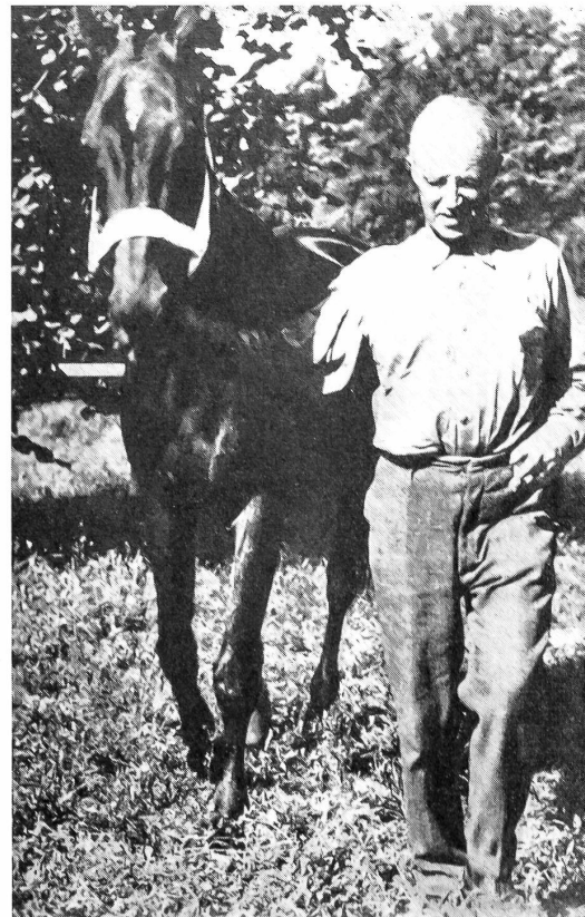
«Verte-Rive» bei Pully.

Die Leser unserer Zeitung möchten wir auf die Stiftung Militärbibliothek Basel (Schönbeinstraße 20, Basel, Tel. (061) 247827), deren über 30000 Bände zur unentgeltlichen Benützung zur Verfügung stehen, hinweisen.