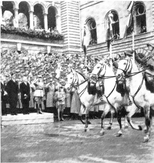
Fahnenkehrung in Bern, 20. Aug. 1945. Der General sprach: «Euer General tritt ins Glid zurück, aber die Armee bleibt in Bereitschaft, und das ist es, was zählt.»

Tatsache ist aber vielleicht noch mehr als bloßer Ausdruck der Sympathie für die Volksverbundenheit, die Tüchtigkeit und das Ansehen des ersten Soldaten, es bedeutet auch Dankbarkeit an den General und ist zugleich ein Symbol jedes einzelnen Offiziers, Unteroffiziers und Soldaten, der mutig, ruhig und treu während sechs Jahren seine Pflicht der Heimat gegenüber erfüllt hat. Das Bild des Generals ist aber auch ein Zeichen der Einheit und Geschlossenheit unserer Armee während des vergangenen Aktivdienstes und sprechender Zeuge der Verbundenheit zwischen Volk und Armee. Möge das Bild des Generals dem Schweizervolke eine stetige Mahnung zur Eintracht, zur Treue und Hingabe an das Vaterland sein. General Guisan wird aber mit einem warmen Glanz in die Schweizergeschichte eingehen. «Il a mérité sa patrie — Er hat sich um das Vaterland verdient gemacht.»