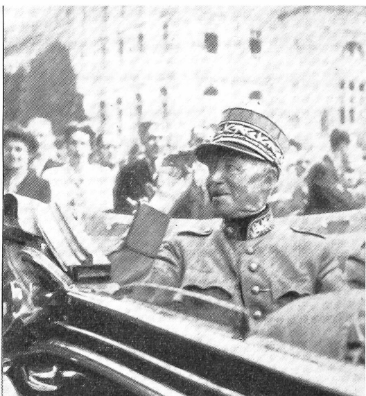
General Guisan verabschiedet sich am 20. Juni 1945 vor dem Parlamentsgebäude.

Der General sprach: «Mein Auftrag ist erfüllt. Ich trete ins Glied zurück und bleibe zur Verfügung meines Landes.»