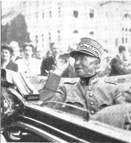
General Guisan verabschiedet sich am 20. Juni 1945 vor dem Parlamentsgebäude.

Der General sprach: «Mein Auftrag ist erfüllt. Ich trete ins Glied zurück und bleibe zur Verfügung meines Landes.»