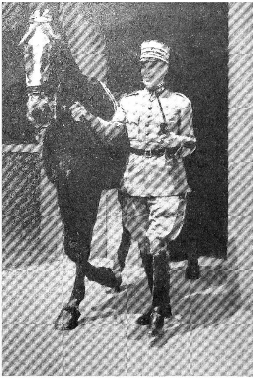
General Guisan mit seinem Dienstpferd «Nobs».

Der General sprach: «Der Motor wird kommen, bestimmt, doch das Pferd bleibt.»