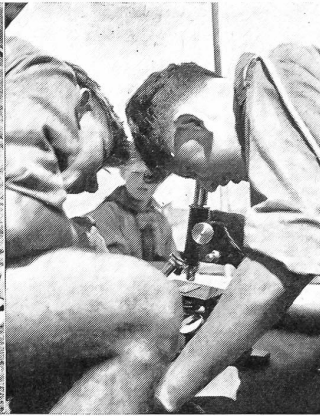
Nicht nur die Armee, auch die Universität macht mit: Zuhilfen des Lagers für Naturkunde und Beobachtung lieh die Universität Neuenburg regelrechte Mikroskope.