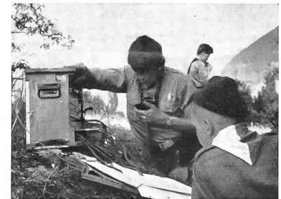
Auch im Gelände hatte man Telephonzentralen der Armee aufgestellt — unermüdet telephonierte die Pfadi dem Gefechtsdraht entlang und meldeten ihre Wahrnehmungen.

Im Uebermittlungslager waren die Armeetf-Zentralen, Einzelapparate und auch die drahtlosen Fox- und TL-Geräte Trumpf. Mit welchem Eifer die Pfader sich in die technischen Belange einführen ließen und mit welchem Interesse sie mit dem Armeematerial und den Armeegeräten umgingen, zeigt unsere Bilderserie. H. F.