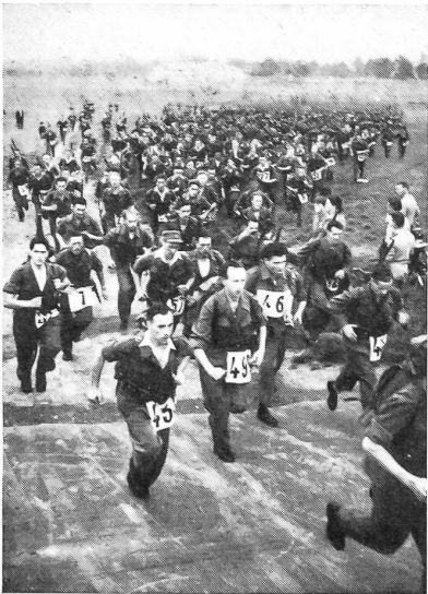
6. Berner Waffenlauf vom 12. 9. 1954 Start der 650 Läufer