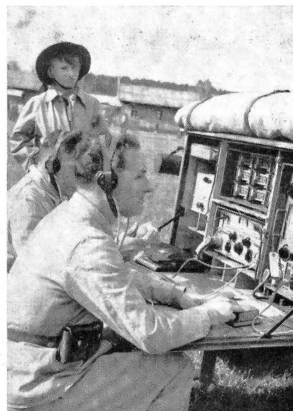
Tag der Uebermittlungstruppen in Dübendorf. Aus dem Gruppenwettkampf für Stationsmannschaften.