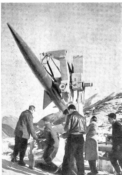
Fernlenk-Raketen-Schießversuche im Gebirge

Auf Grund der eingangs erwähnten Feststellungen soll nicht verschwiegen werden und sei im besonderen darauf hingewiesen, daß gerade für einen Kleinstaat solche Fernlenk-Raketen für die nächste Zukunft wohl das einzige für unsere Verhältnisse noch einigermaßen erschwingliche und erfolgversprechende Verteidigungsmittel unserer Städte und Industriezentren gegen allfällige Angriffe aus der Luft darstellen.