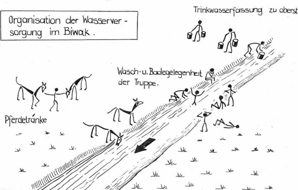
Organisation der Wasserversorgung im Biwak.