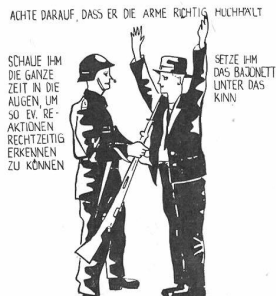
UNTERSUCHEN VERDÄCHTIGER ALLEIN

ACHTE DARAUF, DASS DU NICHT IN DER SCHUSSLINIE DEINES KAMERADEN STEHST!