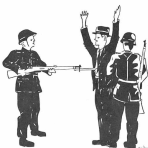
UNTERSUCHEN VERDÄCHTIGER ZU ZWEIT

ACHTE DARAUF, DASS DU NICHT IN DER SCHUSSLINIE DEINES KAMERADEN STEHST!