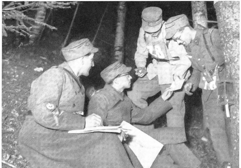
Die Nachtorientierungsläufe der Schweizerischen Offiziersgesellschaft bilden jeweils harte Prüfungen, die von den Zweierpatrouillen körperliche Ausdauer und militärisches Wissen fordern. Schnappschuß auf einem Kontrollposten, wo eine Meldung über die nächste Aufgabe Auskunft gibt.

— die dauernde Nachführung der Korpskontrolle und der Dienststats sowie die Erstellung der damit zusammenhängenden Rapporte;