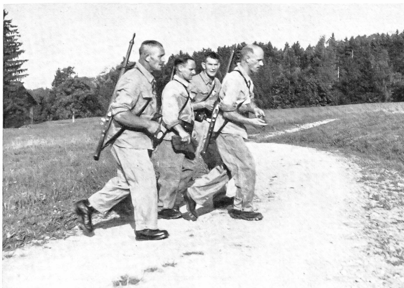
Nicht nur die jungen Wehrmänner, sondern auch die alten Semester haben Freude an der außerdienstlichen Tätigkeit und sehen ihre Notwendigkeit ein. Eine Patrouille junggebliebener Troupiers anlässlich eines Orientierungslaufes an einem Wettkampf des Schweizerischen Unteroffiziersverbandes, der mit 18 000 Mitgliedern in 134 Sektionen zu den rührigsten Wehrverbänden der Schweiz gehört.

Effekten betreuen und auch sonst alles in ihren Kräften liegende tun, um ihren Männern die Härten des Dienstes zu mildern.