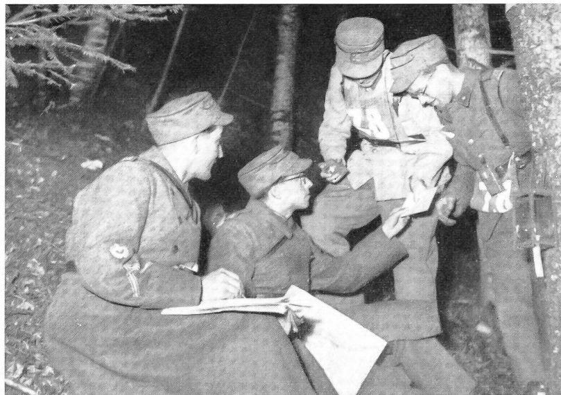
Die Nachtorientierungsläufe der Schweizerischen Offiziersgesellschaft bilden jeweils harte Prüfungen, die von den Zweierpatrouillen körperliche Ausdauer und militärisches Wissen fordern. Schnappschuß auf einem Kontrollposten, wo eine Meldung über die nächste Aufgabe Auskunft gibt.