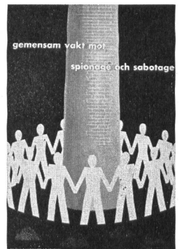
Gemeinsame Wacht gegen Spionage und Sabotage.