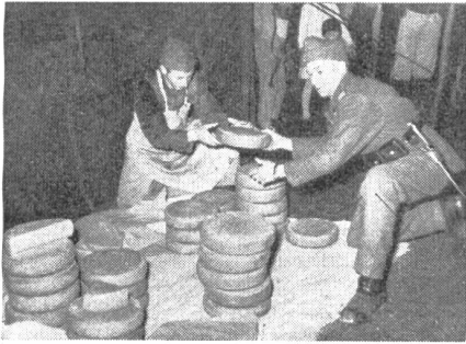
Von der Arbeit unserer Verpflegungstruppen. Im Käsemagazin herrscht Hochbetrieb.