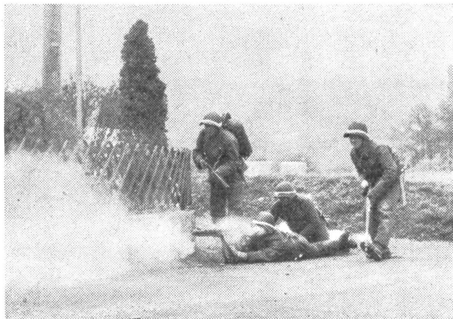
Ein Grenadier-Stoßtrupp im Ortskampf

In diesem Abschnitt wird eingehend die Methodik der Übungen besprochen, mit denen die jungen Offiziere in die Organisation des Gefechtsschießens eingeführt werden sollen. Die erste Grundlage bildet die Arbeit am Sandkasten, um die Arbeit des Übungsleiters kennenzulernen. Im Reglement werden 21 verschiedene Aufgaben angeführt, welche die Einrichtung des Übungsplatzes, der Ziele, der Schutzwehren bis zur Ausarbeitung der taktischen Situation behandeln. Dazu gehören auch die Berechnung der Verbindungsmittel und die Aufstellung der Resultatlisten, welche die erreichten Leistungen festhalten sollen.