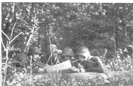
Die erste Phase der Übung hat begonnen. Der Gruppenführer orientiert sich mit seinen Kameraden über die Lage.