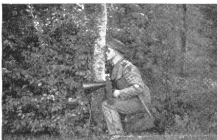
Der «Feind» lauert mit dem Markiergerät.

beanspruchen für ihre Hingabe keinen Dank. Sie erachten das als selbstverständlich und als für ihren Grad verpflichtend. Aber ihr Einsatz und ihre Gesinnung verdienen Anerkennung und Nachahmung. Deshalb haben wir diese Zeilen geschrieben und deshalb veröffentlichen wir die Schnappschüsse eines Teilnehmers an irgendeiner Felddienstübung «neimet i dr Schwyz».