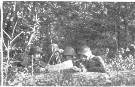
Die erste Phase der Übung hat begonnen. Der Gruppenführer orientiert sich mit seinen Kameraden über die Lage.