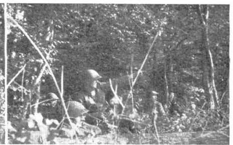
«Ziel! Das Bauerngehöft östlich der Felsenkuppe!»