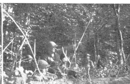
«Ziel! Das Bauerngehöft östlich der Felsenkuppe!»