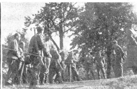
Übungsende. Übungsleiter und Inspektor bei der Besprechung vor den Sektionsmitgliedern.