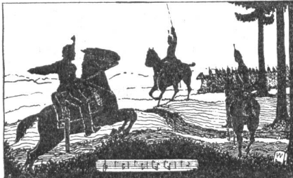
Kavallerie (von Wilfried Schweizer)

Wollen wir unsere Mitbürger vor dem Eintritt in die Fremdenlegion bewahren, so müssen wir viel früher einsetzen und vor allem dafür sorgen, daß sie nicht auf die schiefe Bahn geraten. F.