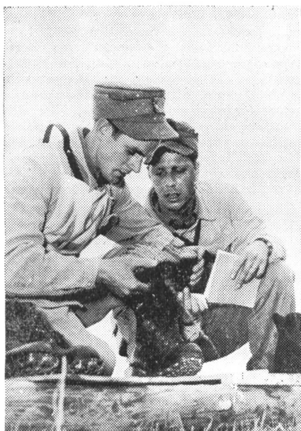
2. Schweiz. Feldweibeltage in Zürich.

Je vollkommener die hochentwickelte technische Wissenschaft unserer Tage die Feuerwaffen gemacht und andere raffinierte Mittel gebracht hat, desto mehr erfordert die Kunst, sie richtig zu brauchen und vollen Nutzen von ihnen zu haben, das Manneswesen, das gleichmütig sagt, wenn es hätte sein müssen, wäre es auch ohne die gegangen. General Wille (1848—1925)