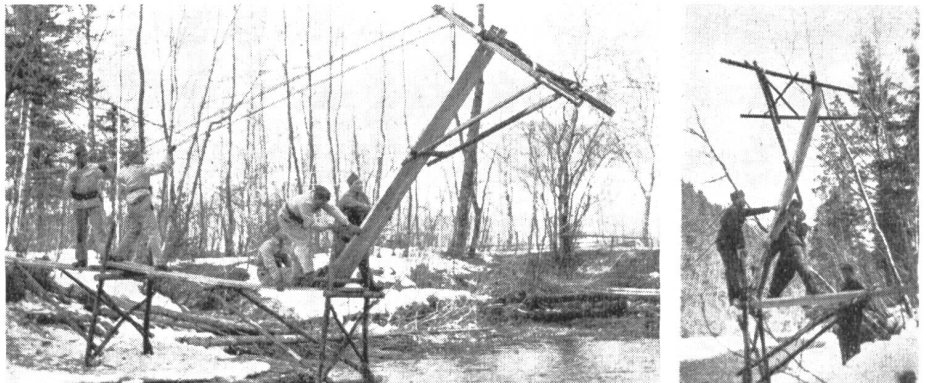
Einbau des Klappsteges dch. Gr.-Kp. 15 im WK 1953 über die Emme. Einbau des Klappsteges.