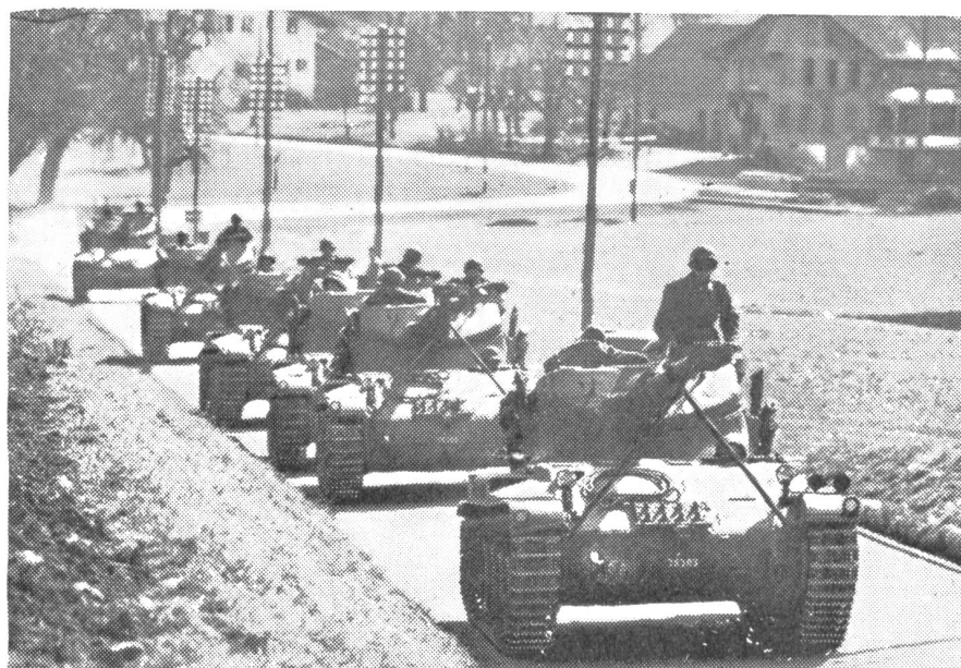
Ein Bild, das da und dort nicht mehr fremd anmuten wird: Straßenfahrt mit L. Pz. 51.

fügung stehende Zeit. Die Wehrmänner, welche sich freiwillig für die Umschulung gemeldet hatten, leisten dieses Jahr zu ihrem Wiederholungskurs freiwillig noch weitere drei Wochen Dienst. Von diesen sechs Wochen stehen für die Ausbildung selbst aber nur rund fünf zur Verfügung, denn abzuziehen sind Einrückungs- und Entlassungstag und die Zeit für die Umbe- waffnung und sonstige Zeughausarbeiten. Die Fahrzeugfassung, der Großparkdienst und die Fahrzeugabgabe beanspruchen ebenfalls drei bis vier Tage. Die kurze Aus- bildungszeit zwingt zu einer restlosen Spe- zialisierung, auch wenn man kein Freund dieses Systems ist. Während des Umschu- lungskurses wird ein Mann entweder als Pan- zerfahrer oder Panzerriecher oder Panzer-