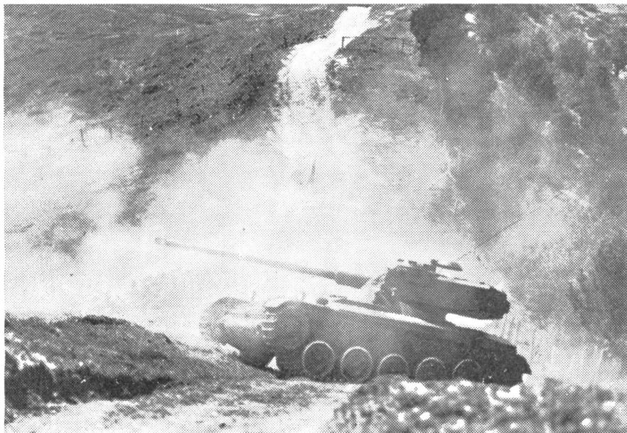
L. Pz. 51, wie der französische AMX-13-Leichtpanzer bei uns offiziell heißt, in Feuer- stellung anlässlich eines Gefechtsschießens im Gurnigelgebiet. Das Geschütz kann dank dem um 360 Grad drehbaren Turm rasch in jede Richtung schießen.

längerer Zeit verfolgen zu können. Prak- tisch muß man damit rechnen, daß rund ein Jahr vor der Einführung neuer Panzer mit der Ausbildung der Instruktoren be- gonnen werden muß.