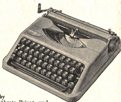
Hermes-Baby die weltberühmte Privat- und Reiseschreibmaschine jetzt in ganz neuer Ausführung mit 20 Verbesserungen Fr. 245.—