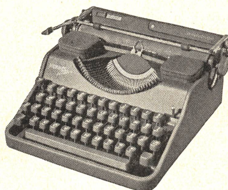
Hermes-Media das hundertfach bewährte schweizerische Armeemodell in robuster, äußerst strapazierfähiger Ausführung jetzt mit Blocktasten Fr. 350.—

HERMAG Hermes-Schreibmaschinen AG, Zürich 1 Waisenhausstraße 2, Telephon (051) 25 66 98 Generalvertretung für die deutsche Schweiz