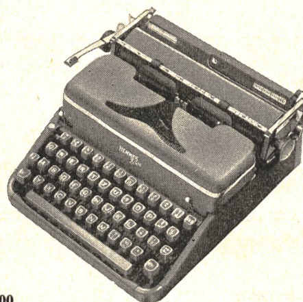
Hermes 2000 Luxusportable mit den Einrichtungen einer modernen Büromaschine. Leicht, leise und schön schreibend Fr. 470.—