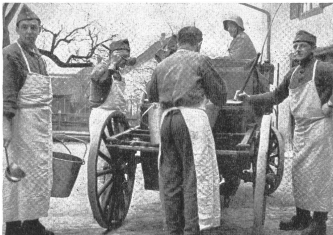
Küchendienst an der alten Fahrküche.

Im Jahre 1953 gaben die Rechnungsführer insgesamt Fr. 13 234 544.54 für die direkte Beschaffung von Lebensmitteln aus. Das macht bei 7 826 888 Naturalverpflegungstagen auf den Verpflegungstag berechnet Fr. 1.70 aus. Dazu wurden aus den Armeeverpflegungsmagazinen ohne Bezahlung, gegen Gutscheine, Armeeproviand, Konserven, Zwischenverpflegungsartikel und dergleichen für Fr. 6 373 137.10 bezogen, was auf den Naturalverpflegungstag Fr. —.81 ergibt. Die Gesamtkosten der Naturalverpflegung betragen somit Fr. 19 907 681.64 oder Fr. 2.51 je Naturalverpflegungstag. Außerdem wurden noch Fr. 2 310 862.— für Geldverpflegung an Wehrmänner ausbezahlt, welche nicht in natura verpflegt werden konnten. Dieser Betrag verteilt sich auf 698 212 Geldverpflegungstage. Die 7 826 888 Naturalverpflegungstage und 698 212 Geldverpflegungstage entsprechen zusammen der Totalberechtigung von 8 525 100 Soldtagen. Der Gesamtaufwand von Fr. 22 218 543.64 wird