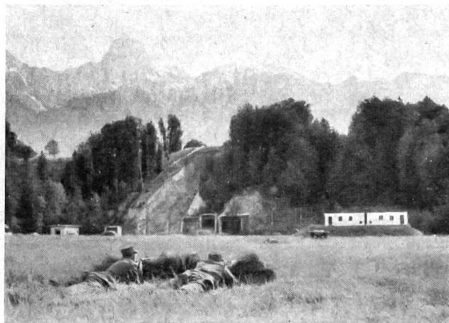
Die Wettkampfanlage während des Wettkampfes in ca. 140 m Distanz. Hier ist ersichtlich, daß es für die Bekämpfung des Gegners im kleinen Kellerfenster einen besonders guten Schützen braucht. Im Kriege dürfte hier der Zielfernrohr-Karabiner zum Einsatz gelangen.

war auf 25 Sekunden verlängert. Die Intervalle, die für alle Gruppen dieselben waren, waren den Schützen unbekannt und wurden geheim gehalten. Es ging bei dieser Übung einmal darum, den Schützen in eine bestimmte Lage zu versetzen, seine Aufmerksamkeit anzuspannen und ihn zu einem raschen und präzisen Nachladen in Deckung zu erziehen. Dem Gruppenführer fiel zudem die Aufgabe zu, seine Leute auf Grund ihrer Schießfertigkeit auf die verschiedenen Ziele (Hausöffnungen) zu verteilen und das Visier zu befehlen.