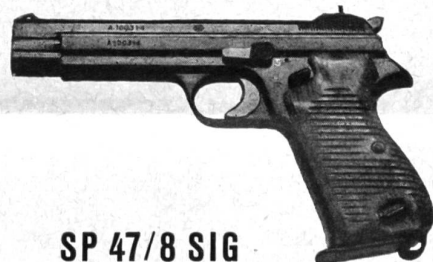
SP 47/8 SIG

Die bewährte Selbstladepistole der Neuhauser Waffenfabrik