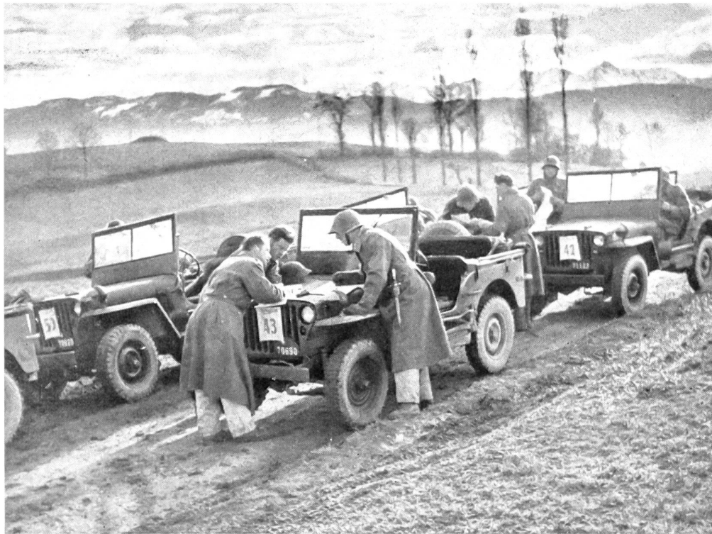
Befehlsausgabe und Kartenstudium im freien Gelände.