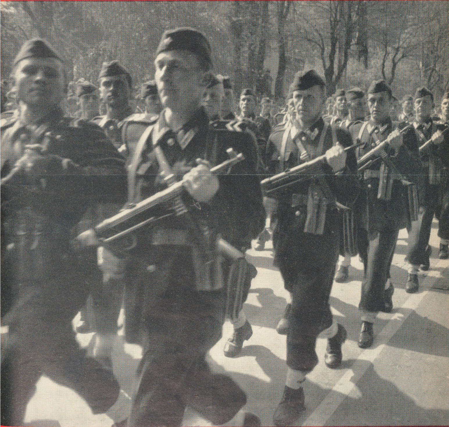
Unser Titelbild: Einheit der Volksmiliz an der Maiparade 1952 in Ljubljana.

Aus dem Inhalt: Was subalterne Offiziere in der Ausbildung vermissen / Nachtkampf / Der bewaffnete Friede / Die Anlage von Feldbefestigungen und die Ausführung wichtiger Pionierarbeiten durch die Infanterie / Der Zentralvorstand tagt / Büchertisch.