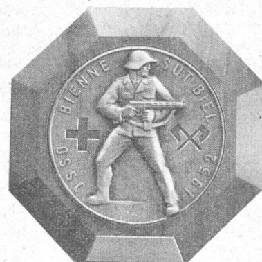
HUGUENIN LE LOCLE

Sektionsplakette in Silber und Bronze (in reduzierter Größe)