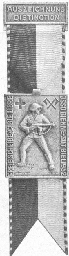
HUGUENIN LE LOCLE