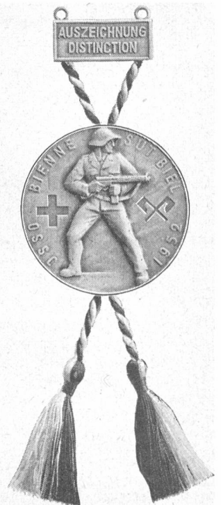
HUGUENIN LE LOCLE