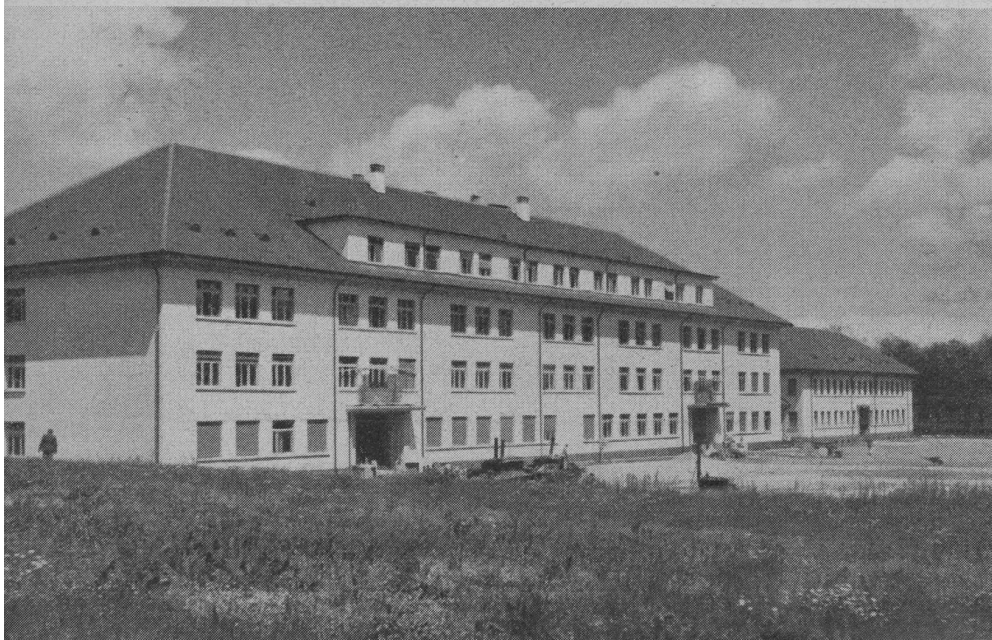
Teilansicht der neuen Kaserne «La Poya» der Inf.-Uebermittlungstruppen in Freiburg.