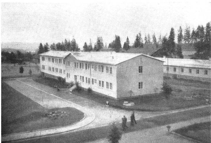
Ein Kompaniehaus des Husebylagers.

Das Ausbildungslager der Garde verfügt auch über eine eigene Turnhalle und über eine geräumige Sauna. Inmitten des Lagers steht das von den Gardisten selbst