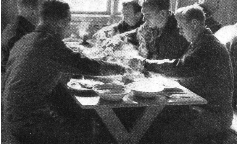
In der Mannschaftskantine wird eine gute und reichhaltige Verpflegung abgegeben. Der Begriff «Faßmannschaft» ist hier unbekannt, da jeder Soldat seine Portionen am Büfett abholt und dort auch nachfassen kann.

erbauten Soldatenhaus mit heimeligen Aufenthaltsräumen und einer Bibliothek. Das neue Kino gehört zu den größten norwegischen Soldatenkinos, wo neben Unterfilmsfilmen auch Unterhaltung geboten wird. Eine gut eingerichtete Bühne gestattet Theater- und Kabarettvorführungen, die oft von den Gardisten selbst bestritten werden.