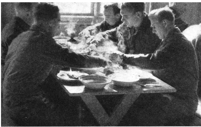
In der Mannschaftskantine wird eine gute und reichhaltige Verpflegung abgegeben. Der Begriff «Faßmannschaft» ist hier unbekannt, da jeder Soldat seine Portionen am Büfett abholt und dort auch nachfassen kann.

erbaute Soldatenhaus mit heimeligen Aufenthaltsräumen und einer Bibliothek. Das neue Kino gehört zu den größten norwegischen Soldatenkinos, wo neben Unterhaltungsfilmen auch Unterhaltung geboten wird. Eine gut eingerichtete Bühne gestattet Theater- und Kabarettvorführungen, die oft von den Gardisten selbst bestritten werden.