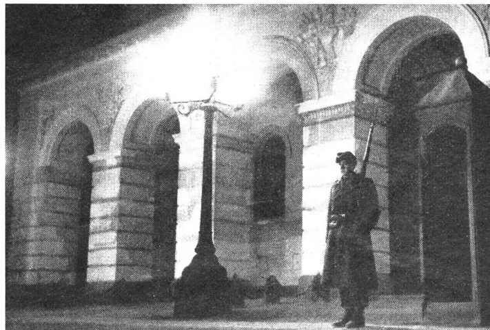
Im Wechsel der Kompagnien gehört die Wache vor dem Königlichen Schloß in Oslo zu den traditionellen Verpflichtungen dieser Truppe.