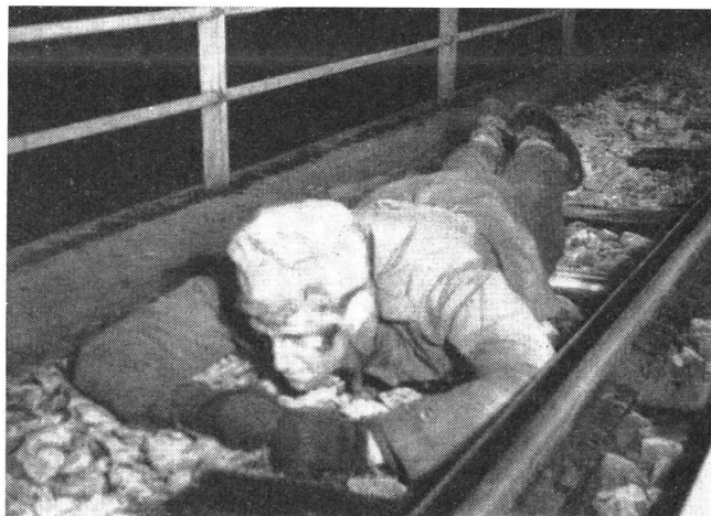
Die Soldaten der Königlichen Garde werden auch für Spezialaufgaben geschult. Aufnahme von einer nächtlichen Partisanenübung.

Norweger ihre Rekrutenschule von 12 Monaten Dauer absolvieren. Die Garde ist eine gesuchte Truppengattung und viele Norweger wünschen, bei der Rekrutierung in sie eingeteilt zu werden. Die Gardekompanien 1 bis 7 werden jeweils aus gleichen Jahrgängen gebildet. So finden wir innerhalb der Königlichen Garde junge und ältere Rekruten. Werden die Männer einer Kompanie nach ihrer Dienstzeit als fertige Soldaten entlassen, wird aus neu einrückenden Rekruten eine neue Einheit gebildet. Die einzelnen Kompanien schließen sich nach ihrer Entlassung oft zu kameradschaftlichen Verbindungen zusammen, um den Kontakt auch in Zukunft zu bewahren. Vergangenes Jahr feierten z. B. die verschiedenen Gardekompanien des Jahres 1925 ihren 25. Jahrestag.