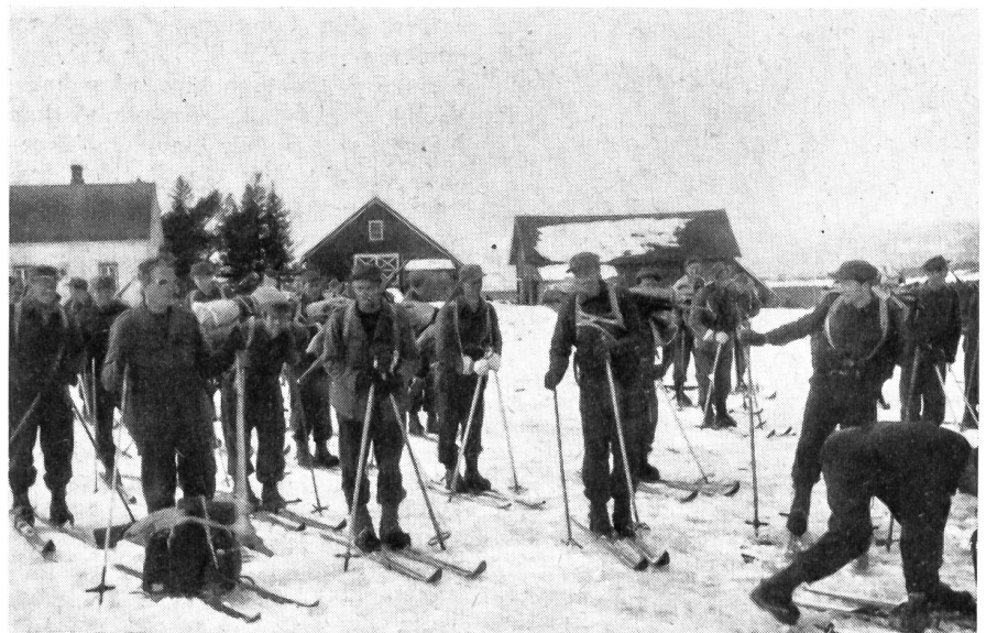
Norwegische Waldarbeiter aus Snosa in Trøndelag an einer Heimwehrübung auf Ski.

Die neuesten Pläne über die Organisation der norwegischen Landesverteidigung bringen einen weiteren Ausbau der Lokal- und Heimwehren. Innerhalb dieser Truppenkörper bilden die Skiläuferabteilungen ein wichtiges Glied ihres Aufbaues. Die Erfahrungen haben bewiesen, daß diese Abteilungen physisch und skitechnisch ihr Ziel erreichen, wenn die Ausrüstung und das Training verbessert werden kann. Es kann damit gerechnet werden, daß der neue Sechsjahresplan der norwegischen Landesverteidigung mit diesen Mängeln aufräumt oder sie wenigstens mildert.