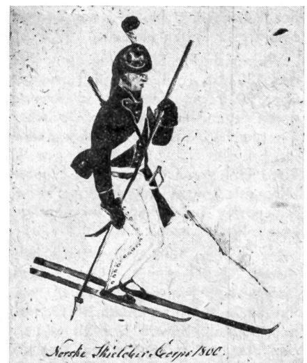
Norwegischer Militär-Skiläufer aus dem 18. Jahrhundert. Man beachte das ungleiche, im Bericht geschilderte Skipaar dieses Soldaten.

Jede Kompagnie verfügte über 14 Skischlitten, die aus einer Art auf Ski montierten Segeltuchkisten bestanden. Auf diese Weise wurden die Munition, der Proviant und selbst kleine