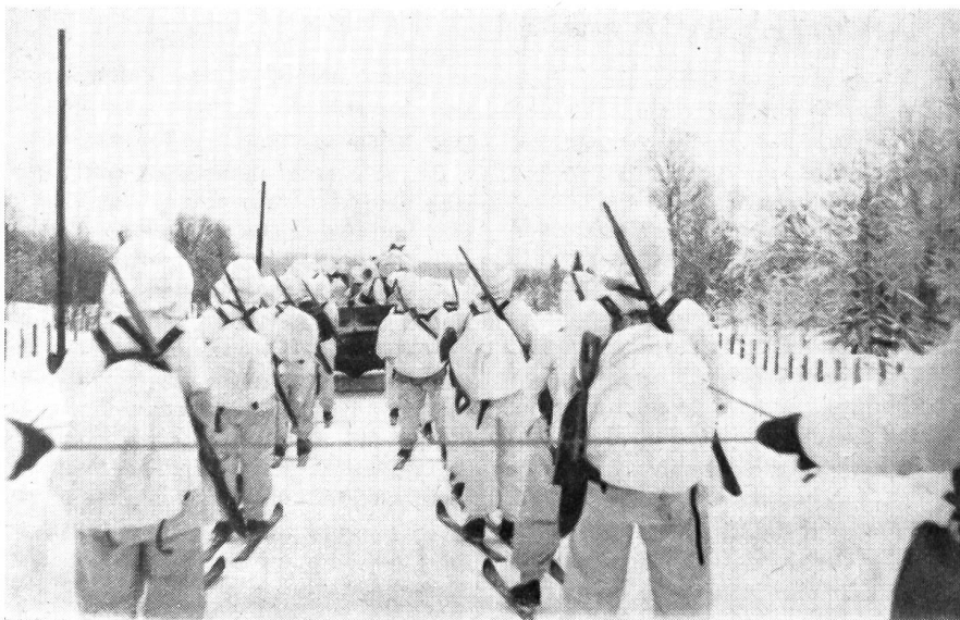
Eine Abteilung schwedischer Gebirgsjäger auf dem Marsch; Skijöring hinter einem Motorwagen.

port von Proviant, Munition, Zelte und der übrigen Ausrüstung angeschafft wurden.