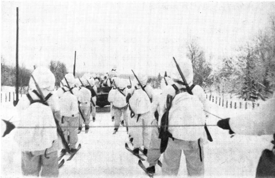
Eine Abteilung schwedischer Gebirgsjäger auf dem Marsch; Skijöring hinter einem Motorwagen.

port von Proviant, Munition, Zelte und der übrigen Ausrüstung angeschafft wurden.