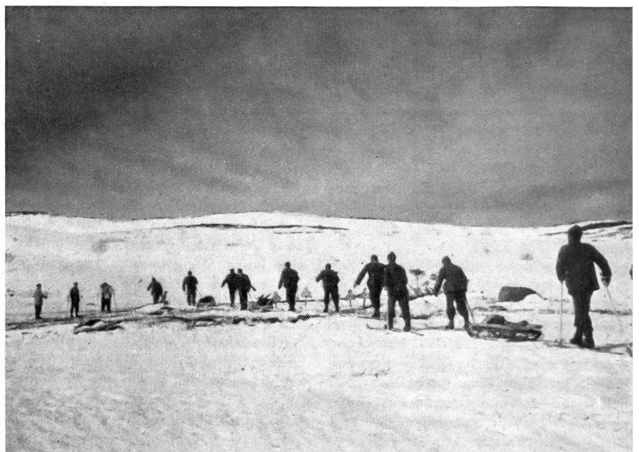
Der Nachschub wird auf besonders leichten Skischlitten nachgeführt.

Als Norwegen um die Jahrhundertwende um die Trennung von Schweden kämpfte, erinnerte man sich wieder dieser Skiläuferabteilungen. Der Skisport erlebte in Norwegen um das Jahr 1890 eine eigentliche Renaissance, die den Charakter einer tiefgreifenden Entwicklung trug. Es wurden neue Formen der Skiausrüstung gefunden und der Skilauf wurde wieder zum Volkssport, was auch seine militärische Bedeutung erneut in den Vordergrund treten ließ. Es kann aber nicht davon gesprochen werden, daß die norwegischen Skiläuferabteilungen jener Zeit für die Landesverteidigung von besonderer Bedeutung waren. Der Ski wurde nur als ein Transportmittel betrachtet, das von den betreffenden Abteilungen im Sommer einfach gegen Fahrräder eingetauscht wurde. Wenn man von den Bataillonen in Nordnorwegen absieht, welche Dienst im subarktischen Klima leisten und daher auch mit einer besonderen Ausrüstung und Pelzkleidung versehen sind, die derjenigen der Lappen angepaßt ist, verfügten die norwegischen Skiläuferabteilungen über wenig Spezialausrüstung. Die Ski, die Bindungen und die Stöcke bestanden aus dem einfachen Touren-Typ. Außer einer Skimütze unterschied sich die Uniform nicht von der gewöhnlichen Sommeruniform der Armee. Die Bewaffnung war die gleiche und auch die Zelte unterschieden sich nicht von der übrigen Ausrüstung. Für die großen Winterzelte wurde immerhin ein besonderer Zelttief geschaffen, wie auch handliche Skischlitten für den Trans-