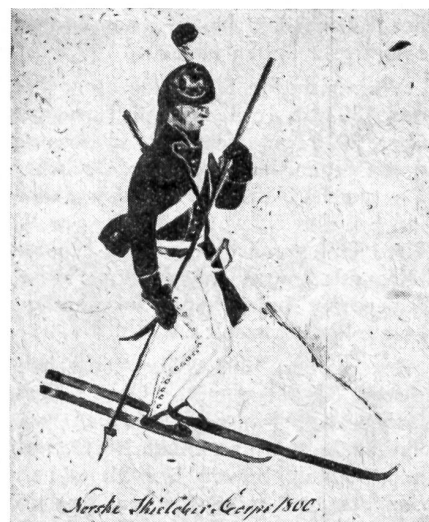
Norwegischer Militär-Skiläufer aus dem 18. Jahrhundert. Man beachte das ungleiche, im Bericht geschilderte Skipaar dieses Soldaten.

Jede Kompagnie verfügte über 14 Skischlitten, die aus einer Art auf Ski montierten Segeltuchkisten bestanden. Auf diese Weise wurden die Munition, der Proviant und selbst kleine