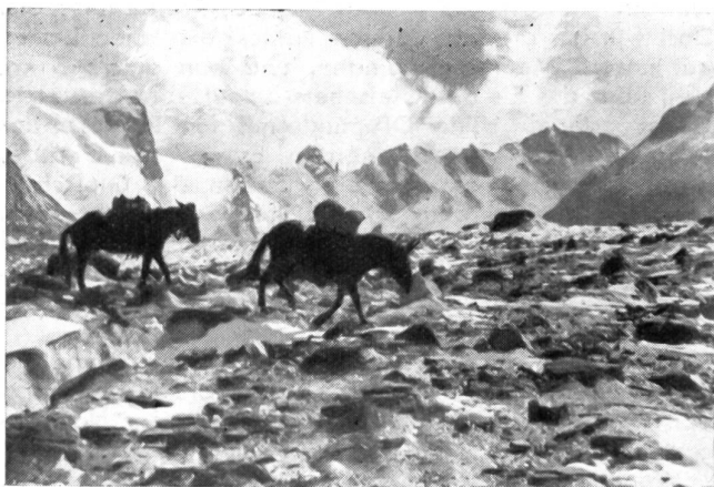
Maultierkolonne auf dem Fornogletscher, Sommerhochgebirgskurs 1940.

Aber auch die Einsatztruppe bedarf eines sorg-