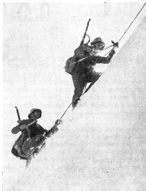
Patrouille im Berninagebiet, Aktivdienst 1939, Geb.Gz.Füs.Bat. 238.

Alles schien zu klappen, als am Dislokationstag vom Detachement Forno die Meldung kam, daß die Saum-