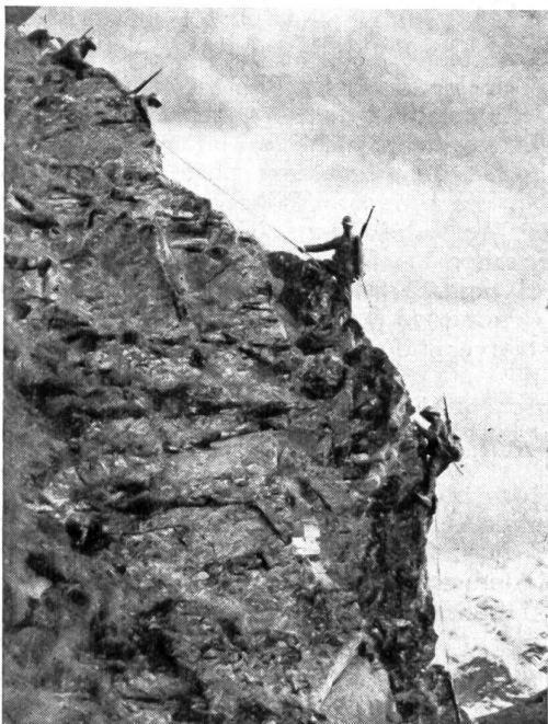
Patrouille im Berninagebiet, Geb.Gz.Füs.Bat. 238, Aktivdienst 1940.

Wenn man bedenkt, welches Holzquantum in den Hütten verbraucht wurde, welche Mengen an Verpflegung, Post und Ersatzmaterial täglich befördert wurden,