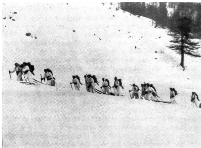
Aufstieg zum Julierpaß mit Kanadierlasten. Stabskp. Geb.Füs.Bat. 91, Januar 1942.

Am Abend wurde durch Vorträge und Diskussionen die Ausbildung vertieft. Was am Tage geübt und gezeigt wurde, war dann Gegenstand gründlicher Besprechung. Theorien über die Gefahren des Hochgebirges und spezielle sanitätsdienstliche Winke wurden den Kurs-teilnehmern gegeben. Oft sah man abends nach dem Einrücken verschiedene Soldaten noch da s üben, was ihnen am Tage nicht einwandfrei gelungen war. Keiner wollte am andern Tag für die Kameraden ein Hemmschuh sein. Dies ist ein Beweis für den guten Geist, der in dieser Truppe herrschte. Der Kurs fiel zeitlich