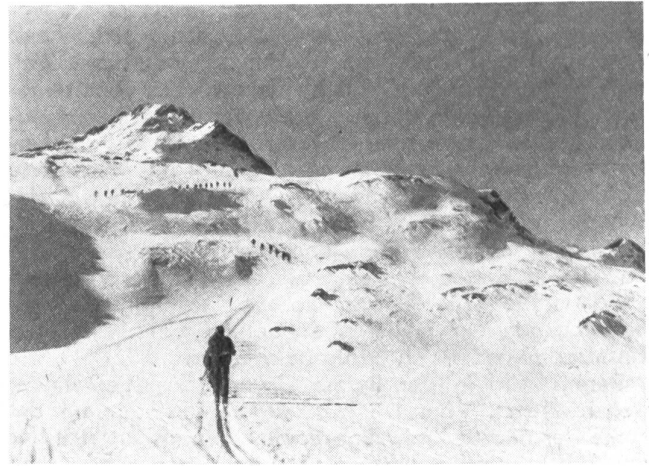
Aufstieg der Klassen zum Winterhorn.

Allgemeines. Nach Ansicht des technischen Leiters erwies sich die Programmgestaltung als zweckmäßig. Die Dispositionen erfolgten kurzfristig, um Wetter, Schneeverhältnisse, Ermüdungsgrad, Können und Stimmung der Teilnehmer einzukalkulieren und ein von jedem Schema freies Programm zu schaffen. Das erreichte Programm darf nicht tel quel als Schema für einen späteren Kurs verwendet werden. Das andauernde glanzvolle Wetter ermöglichte es, die Teilnehmer im Gelände selber auszubilden und die