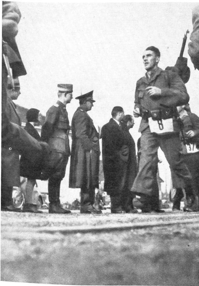
Dem Frauenfelder Armeewettmarsch wohnten dieses Jahr einige Militärattachés bei, die sich für die auferdienstliche Tätigkeit unserer Milizen interessierten.