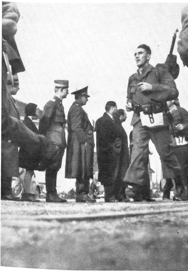
Dem Frauenfelder Armeewettmarsch wohnten dieses Jahr einige Militärattachés bei, die sich für die auferdienstliche Tätigkeit unserer Milizen interessierten.