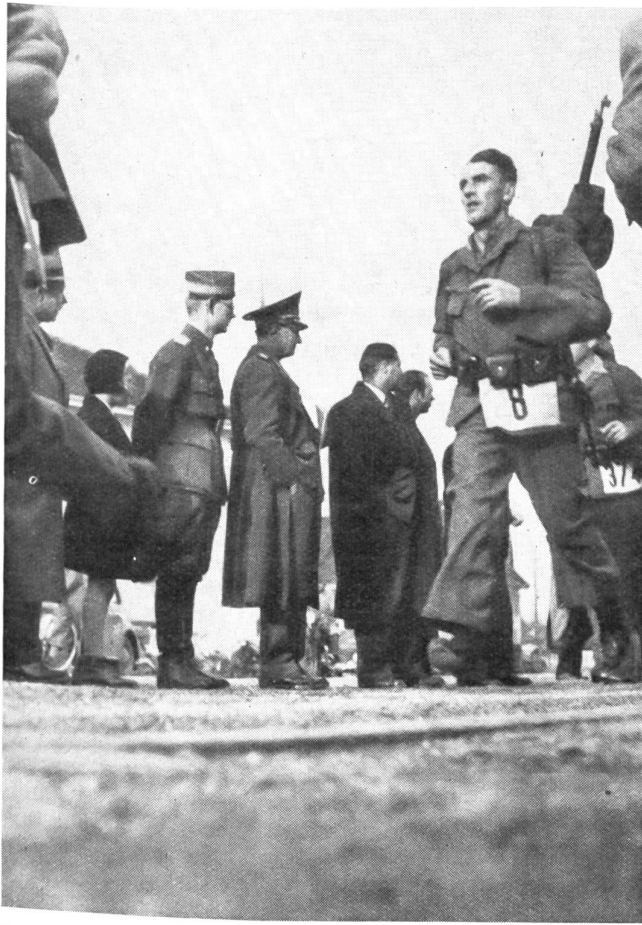
Dem Frauenfelder Armeeweltmarsch wohnten dieses Jahr einige Militärattachés bei, die sich für die außerdienstliche Tätigkeit unserer Milizen interessierten.